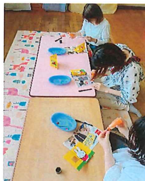
ミッフィーカード完成!

5月20日(水)は、5組の親子にご来園いただき、ミッフィーカードを作りました。子育てする中で、子どもや自身のエピソード等、談笑する場面もあり、楽しいひとときとなりました。6月も是非ご参加下さい!